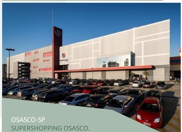
OSASCO-SP SUPERSHOPPING OSASCO.