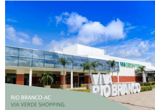
RIO BRANCO-AC VIA VERDE SHOPPING.