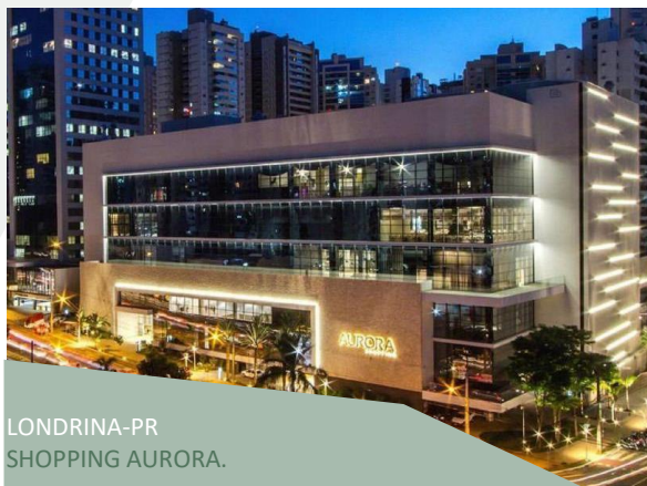
LONDRINA-PR SHOPPING AURORA.