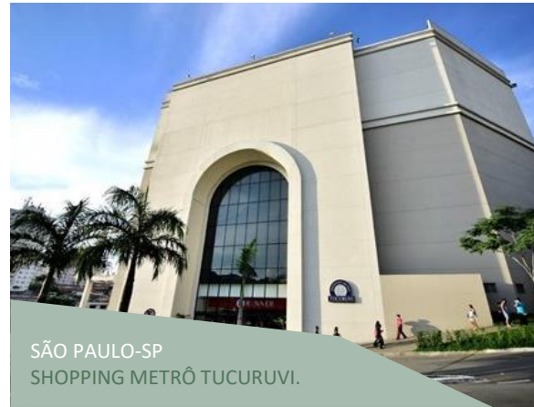
SÃO PAULO-SP SHOPPING METRÔ TUCURUVI.