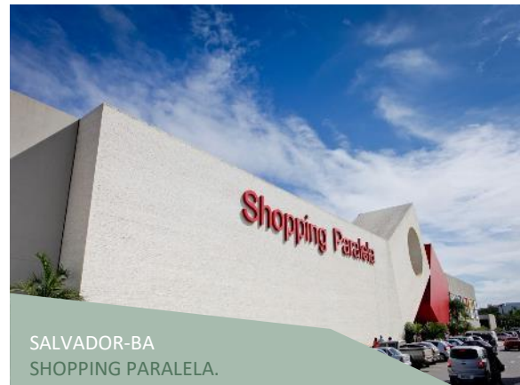
SALVADOR-BA SHOPPING PARALELA.