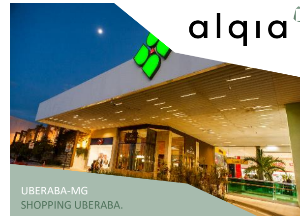
UBERABA-MG SHOPPING UBERABA.