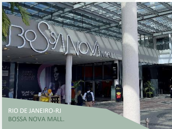
RIO DE JANEIRO-RJ BOSSA NOVA MALL.