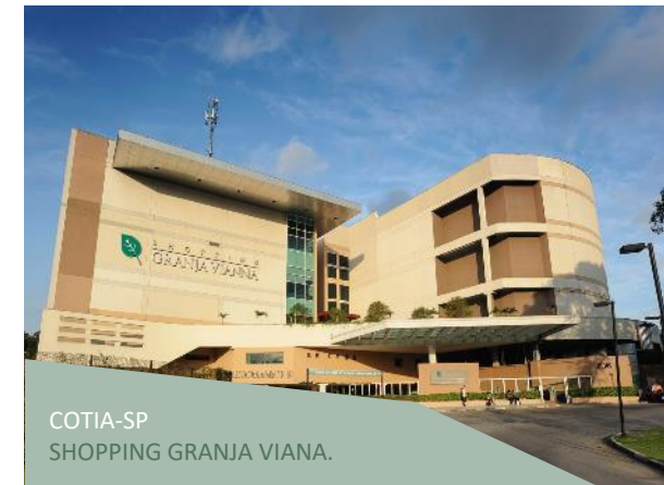
COTIA-SP SHOPPING GRANJA VIANA.