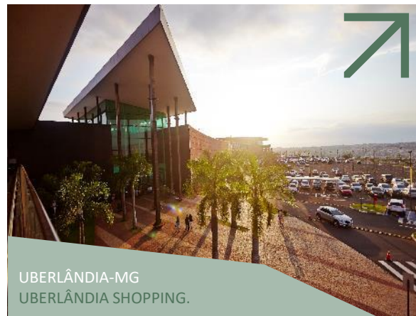
UBERLÂNDIA-MG UBERLÂNDIA SHOPPING.