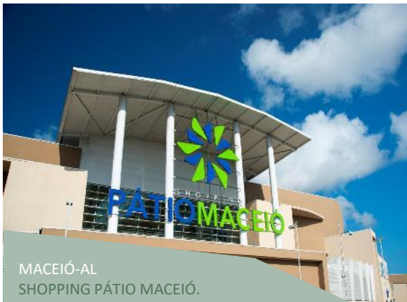
MACEIÓ-AL SHOPPING PÁTIO MACEIÓ.