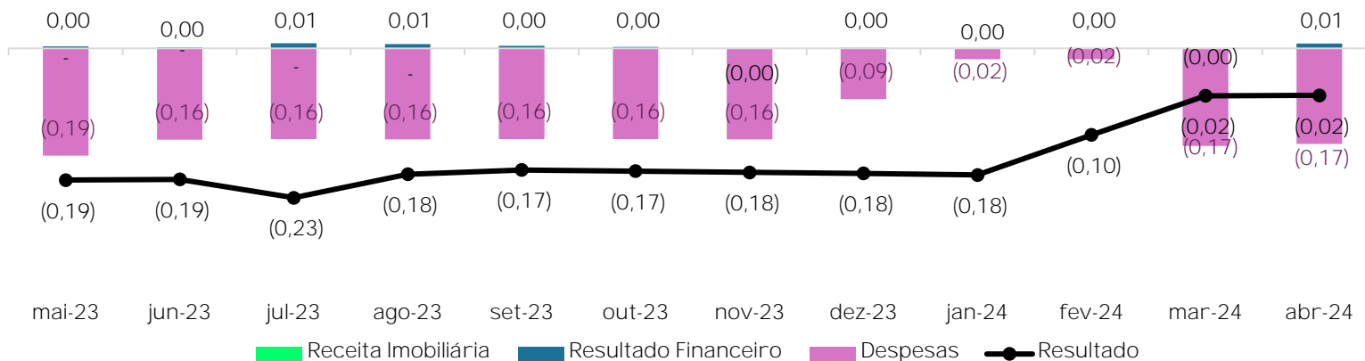
Composição de Resultado nos Últimos 12 meses (R$/cota)

1 Resultado apresentado em regime de caixa e não auditado.