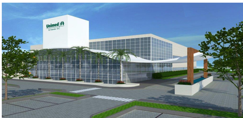
REPRESENTAÇÃO GRÁFICA DO PROJETO

Toda a infraestrutura acessória (cabearno elétrico, sistema de água e esgoto, acesso rodoviário e adaptações para o transporte público) ocorrerão por conta da Unimed Sul Capixaba.