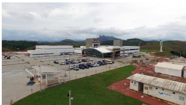
Execução do fechamento das torres e paisagismo externo

O relatório fotográfico contendo as principais modificações na obra no mês de novembro de 2019: