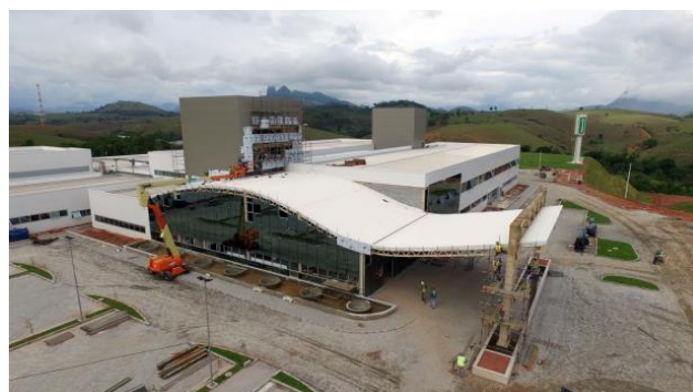
Execução do sistema pele de vidro na fachada da entrada principal