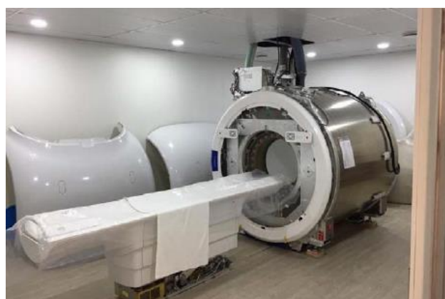
Finalização da sala de Ressonância magnética