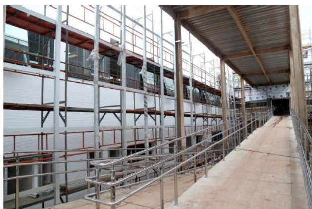
Instalação das esquadrias da rampa