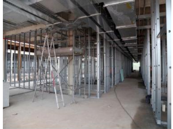
Montagem dos montantes de dry wall e instalação de eletrocalhas - Internação