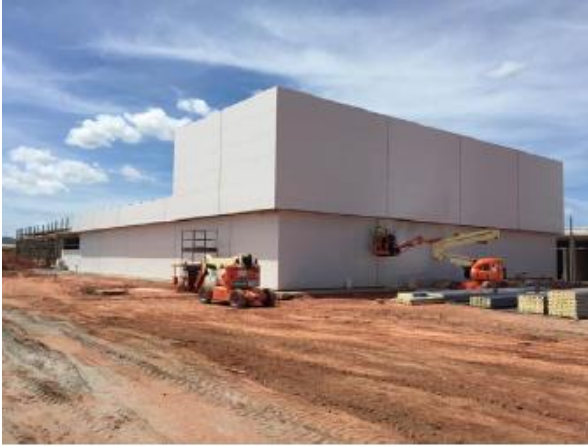
Montagem do isopanel nas fachadas – Bloco 3

O relatório fotográfico contendo as principais modificações na obra no mês de Dezembro de 2018: