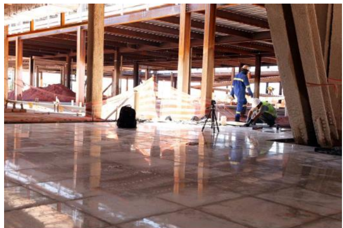
Assentamento de piso em granito