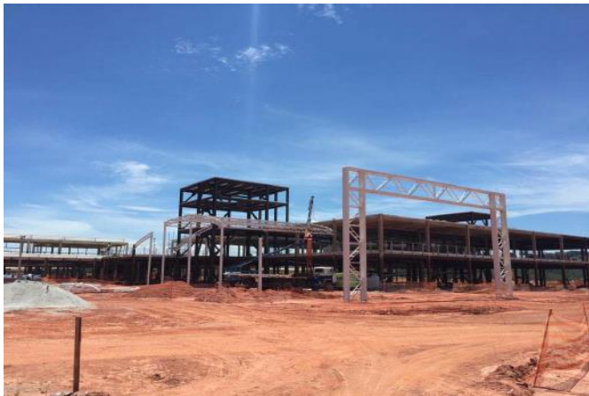
Montagem da estrutura metálica do pórtico de entrada

O relatório fotográfico contendo as principais modificações na obra no mês de Dezembro de 2018: