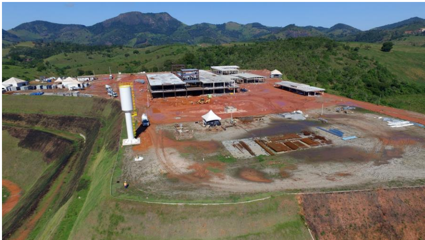
Foto área da obra