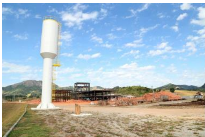
Instalação do Reservatório tipo taça

O relatório fotográfico contendo as principais modificações na obra no mês de Dezembro de 2018: