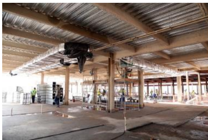
Instalação dos dutos de ar condicionado e hidráulicas