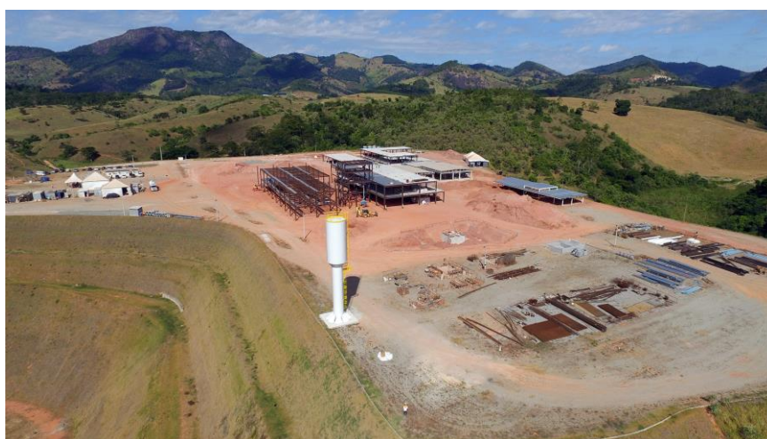
Foto área da obra