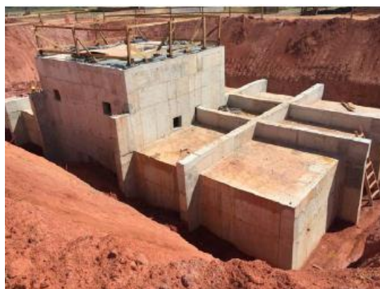
Reaterro Cisterna 1