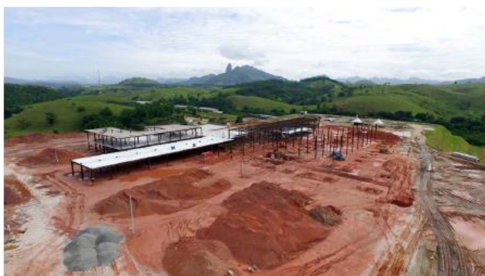
Montagem de estrutura metálica, "Steel Deck"