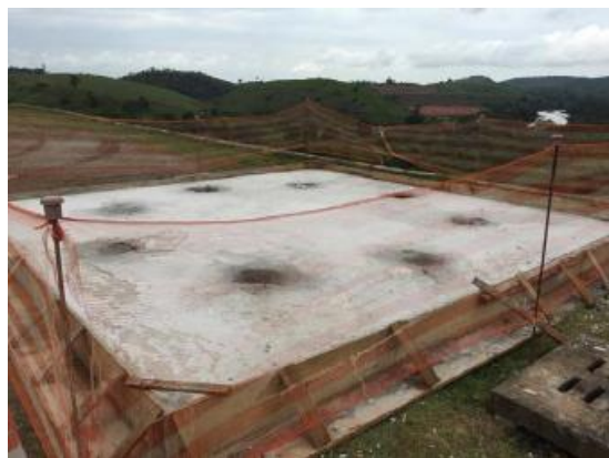
Execução das bases dos reservatórios metálicos

O relatório fotográfico contendo as principais modificações na obra no mês de Novembro de 2018: