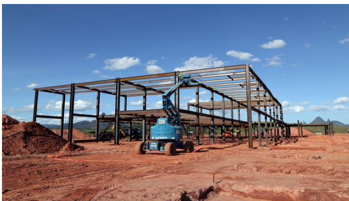
Montagem das vigas metálicas.