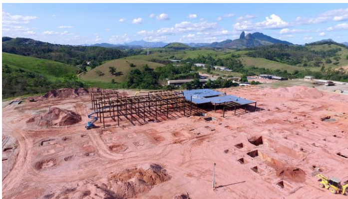
Foto aérea do início da montagem da estrutura metálica.

O relatório fotográfico contendo as principais modificações na obra no mês de Setembro de 2018: