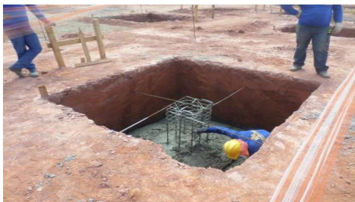
Aplicação de concreto das sapatas isoladas.