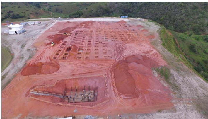
Foto aérea da construção.

O relatório fotográfico contendo as principais modificações na obra no mês de Setembro de 2018: