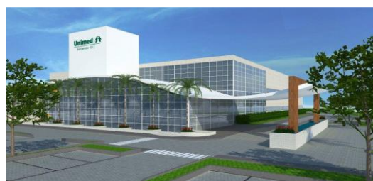
REPRESENTAÇÃO GRÁFICA DO PROJETO

O FII atualmente é proprietário de um terreno de 73.270,00 m 2 localizado no KM 05 da Rodovia Cachoeiro-Safra, no município de Cachoeiro de Itapemirim.