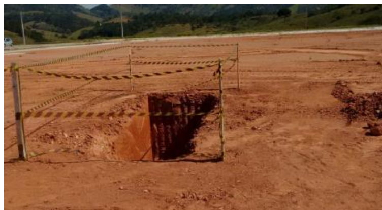
Serviços Preliminares para fundação – Consultoria de solos.