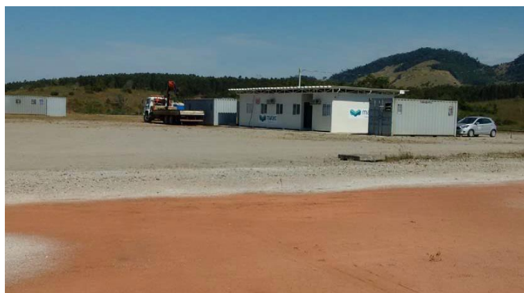
Montagem do canteiro de obras

O relatório fotográfico contendo as principais modificações na obra no mês de Julho de 2018: