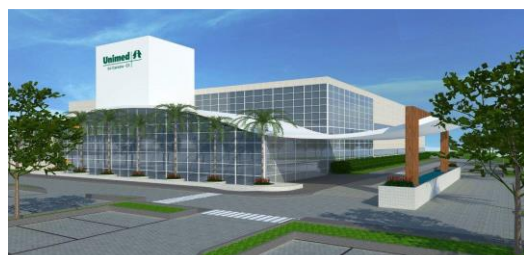
REPRESENTAÇÃO GRÁFICA DO PROJETO

Toda a infraestrutura acessória (cabearno elétrico, sistema de água e esgotamento, acesso rodoviário e adaptações para o transporte público) ocorrerão por conta da Unimed Sul Capixaba.