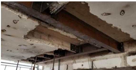
MONTAGEM DOS REFORÇOS METÁLICOS DOS SHAFTS