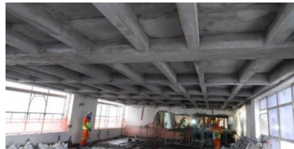
JATEAMENTO DE ARGAMASSA NA FACE INTERIOR DAS LAJES