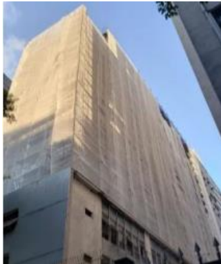
MONTAGEM – ANDAIME FACHADEIRO

Abaixo, as fotos das intervenções realizadas no período: