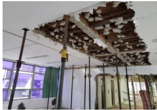
POSICIONAMENTO E CHUMBAMENTO DAS CONTRAMARCAS