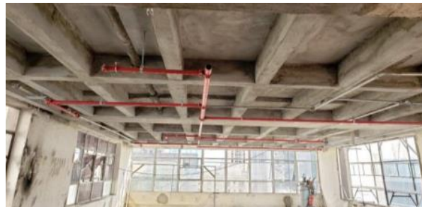
EXECUÇÃO DA INFRA DE DETECÇÃO E SPK