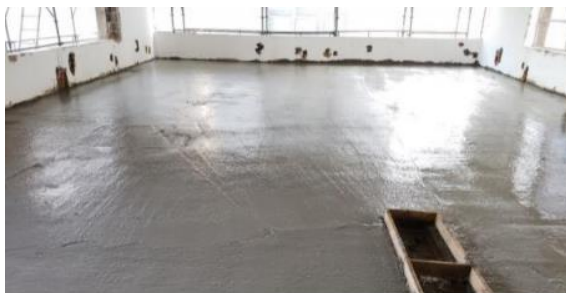
CONCRETAGEM DAS LAJES E APLICAÇÃO DE CURA QUÍMICA