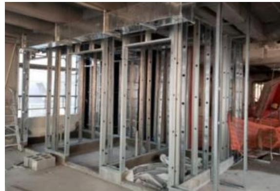
MONTAGEM – PAREDES EM DRYWALL