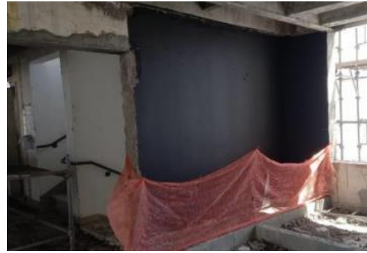
PINTURA – PAREDES DOS SHAFTS