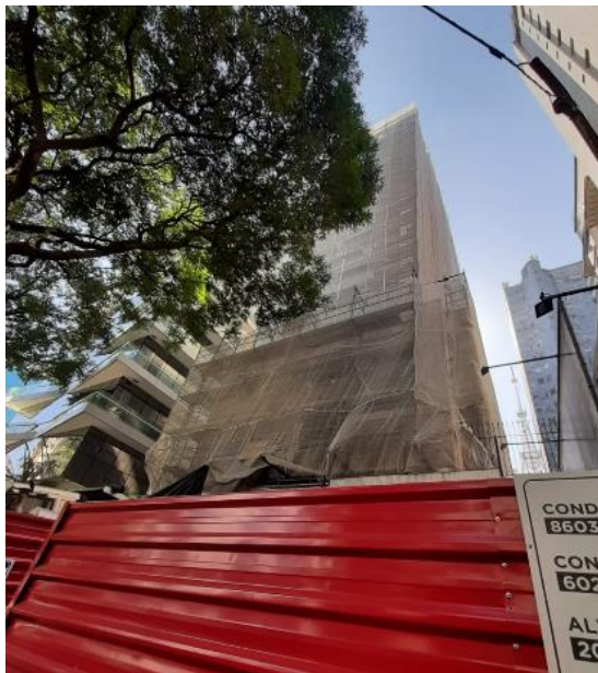
FACHADA DO EDIFÍCIO