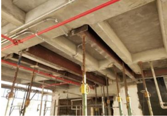
MONTAGEM – REFORÇOS METÁLICOS DOS SHAFTS