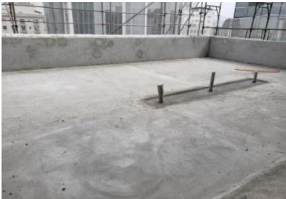
REGULARIZAÇÃO DOS TERRAÇÕES