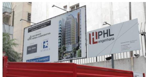
PLACA DE COMERCIALIZAÇÃO DO ATIVO