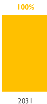
Permanência Garantida por ABL