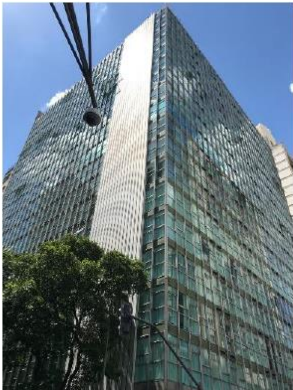
AGÊNCIA RIO BRANCO

Localização: Rua Rio de Janeiro, 654 – Belo Horizonte/MG