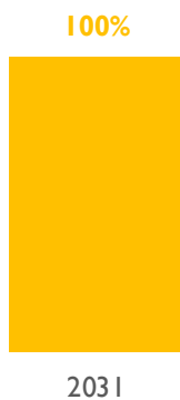
Permanência Garantida por ABL