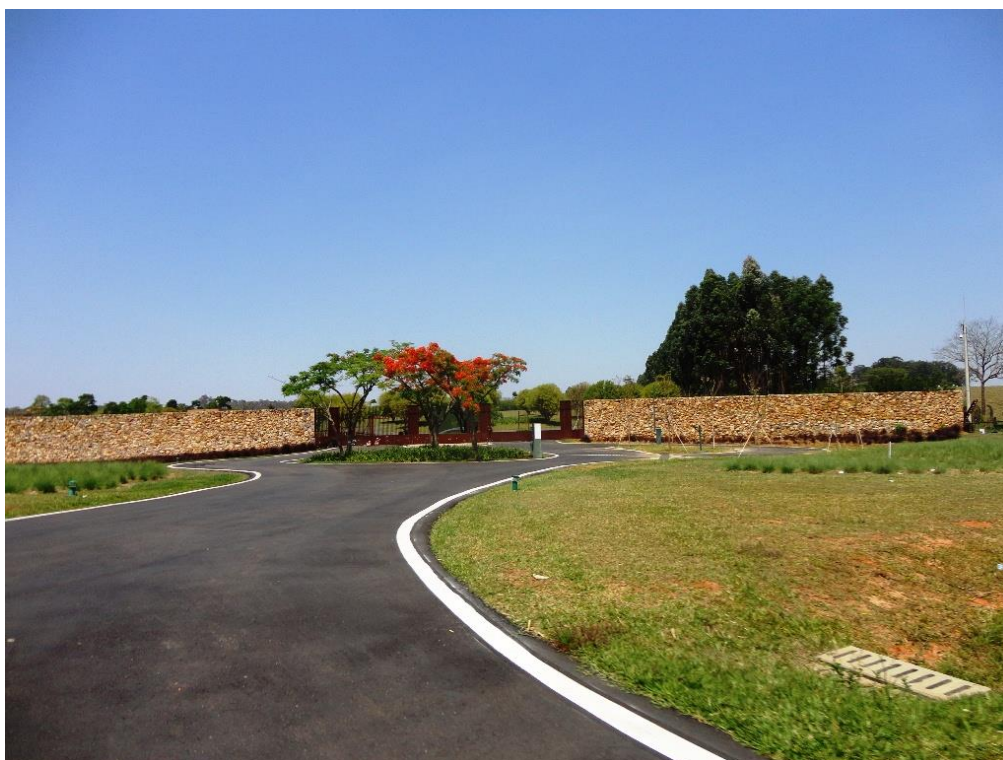
Figura 1 - Entrada da Fazenda Boa Vista