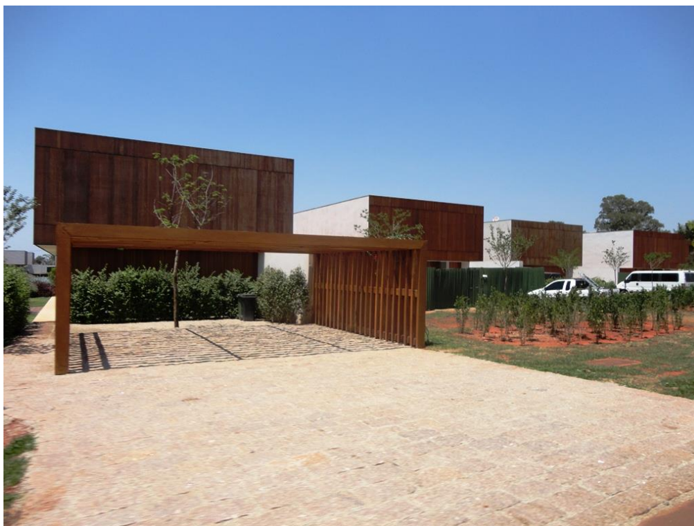
Figura 2 – Villas