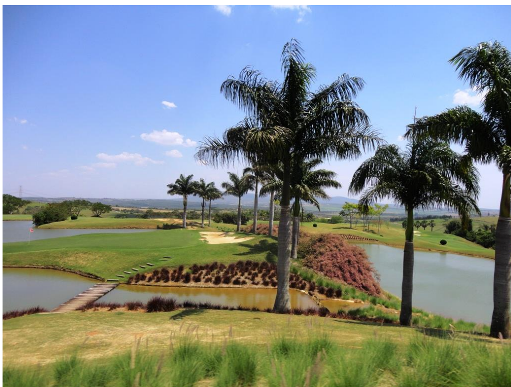
Figura 3 – Campo de Golf